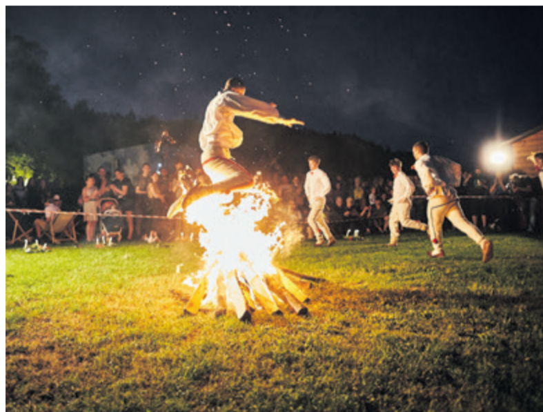
Sezon wydarzeń wakacyjnych rozpocznie Noc Świętojańska

Lato jak co roku będzie obfitować w liczne kulturalne wydarzenia. Sezon rozpoczyna Wibracje Letniego Przesilenia, a zakończy Konfrontacje Zespołów Mażoretkowych. Zachęcamy spędzić go z Chełmińskim Domem Kultury