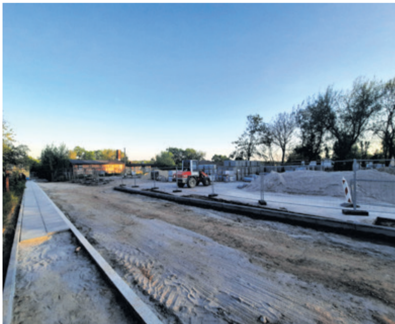
Przy ul. Biskupiej powstaje 40 miejsc parkingowych

kańców okolicy, jak i chełmnianie odwiedzających teren rekreacyjny. – Zrealizowaliśmy ścieżkę w asfalcie, dzięki czemu możliwy