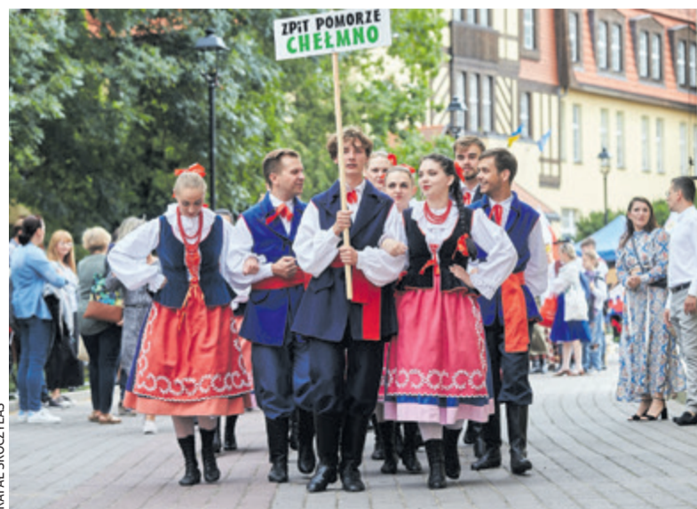
ZPiT „Pomorze” w przyszłym roku będzie obchodzić swoje 45-lecie

„Pomorze” ma na swoim koncie wiele osiągnięć, regularnie koncertuje w regionie, kraju i w Europie. Obecnie zespół przygotowuje się do reprezentowania Polski i Chełmna na VIII Międzynarodowym Festiwalu „Lato w Adrii” (VIII „Summer in Adria” Music Festival), odbywającym się w Selce w Chorwacji. Zaproszenie na takie wydarzenie jest dla reprezentantów