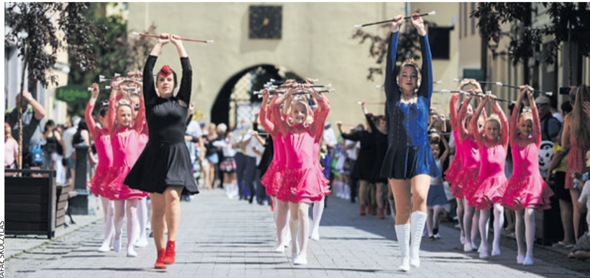
Konfrontacje Zespołów Mażoretkowych odbędą się w Chełmnie 9 września

Mażoretki Chełmińskiego Domu Kultury zachwyciły podczas Mistrzostw Polski w Kętrzynie. Do Chełmna wróciły z 27 tytułami. W ostatni weekend maja wyruszyły na Mistrzostwa Europy. Tu także odniosły sukces