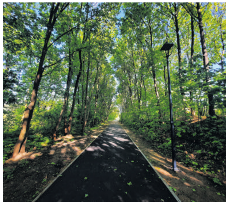
Planty Kolejowe z ul. Brzoskwiniową połączyła ścieżka pieszo-rowerowa