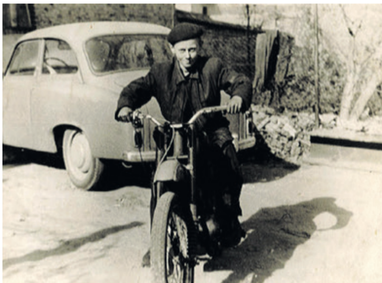
Pierwsze przymiarki do motoru