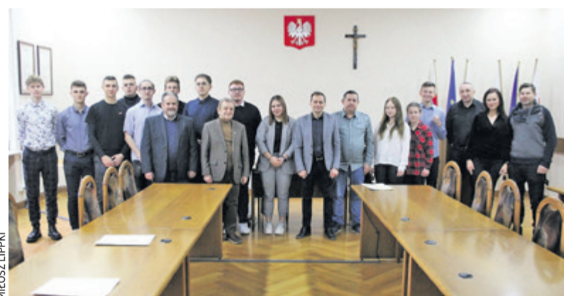
Stypendyści podczas uroczystego wręczenia stypendiów

Burmistrz Chełmna po raz trzeci w historii przyznał stypendia sportowe. Przedstawiamy tegorocznych laureatów