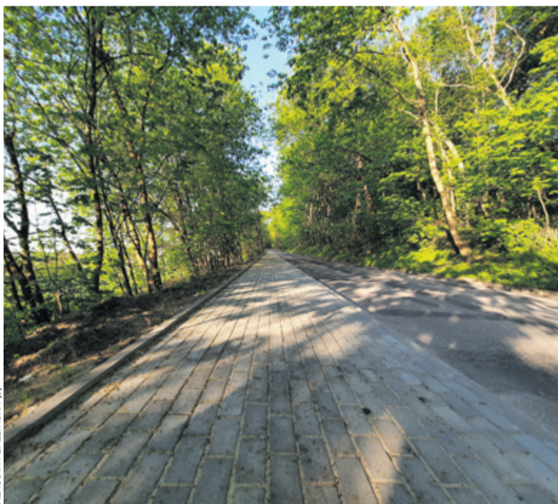
Chodnik z oświetleniem zapewni bezpieczne przejście m.in. nad Jezioro Starogrodzkie