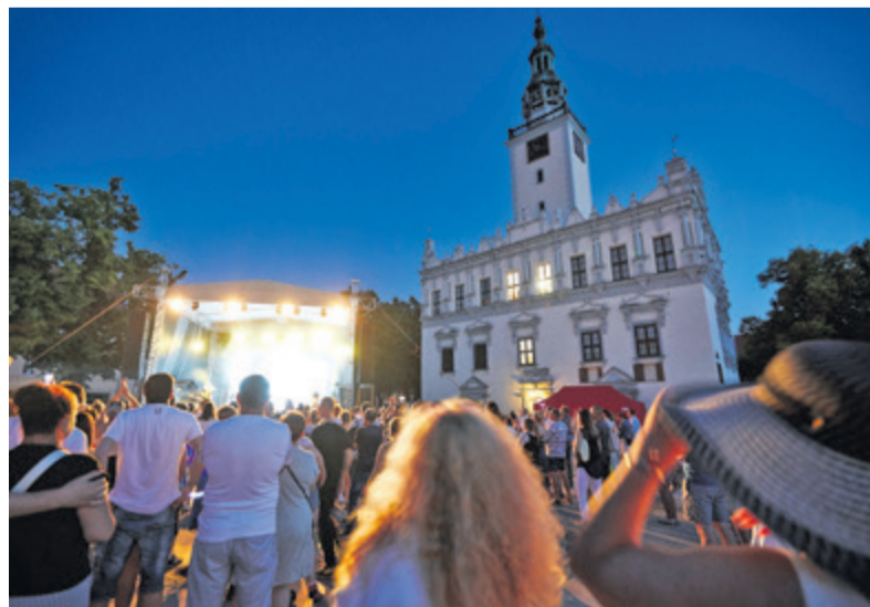
W wakacje nie zabraknie również koncertów na rynku