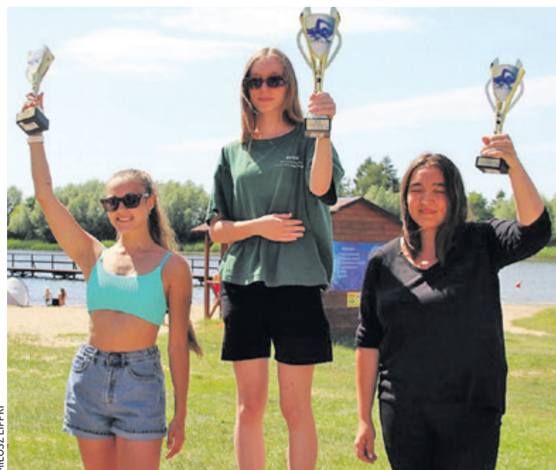
Podium kategorii 1000 m kobiet z zawodów pływackich w Chełmnie w 2022 roku

Zmagania w Chełmnie dokładnie zaplanowano w niedzielę 27 sierpnia. Będzie to jedna z ostatnich imprez w sezonie w tej dyscyplinie sportowej, gdzie apogeum sezonu przypada na wakacje. Zapisy już ruszyły i prowadzone są przez stronę Sportowe Chełmno (www.sportowechemno.pl). Wystartować może każdy. Są to przede wszystkim zawody skierowane do amatorów. W tegorocznej edycji rywalizacja będzie przebiegała na trzech dystansach (100 m kobiet i mężczyzn,